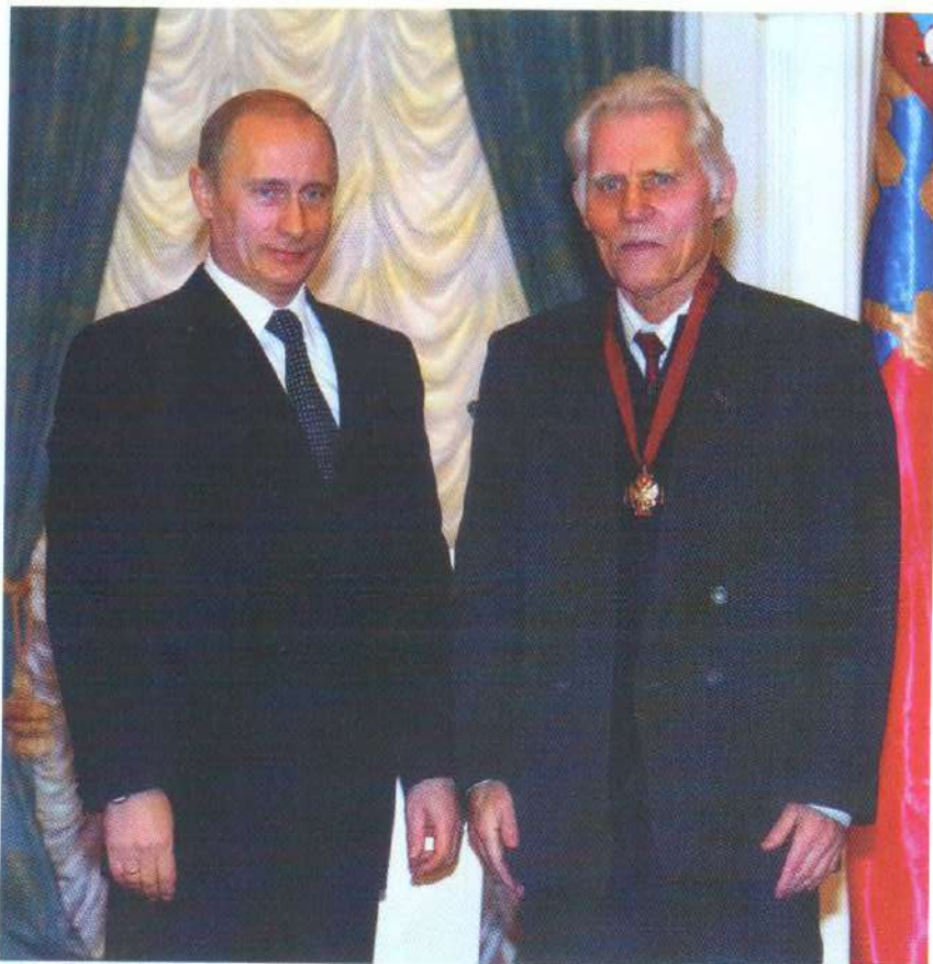
Академик К.А. Валиев и Президент РФ В.В. Путин после вручения Валиеву Государственной премии РФ. Москва, Кремль. 2006 г.